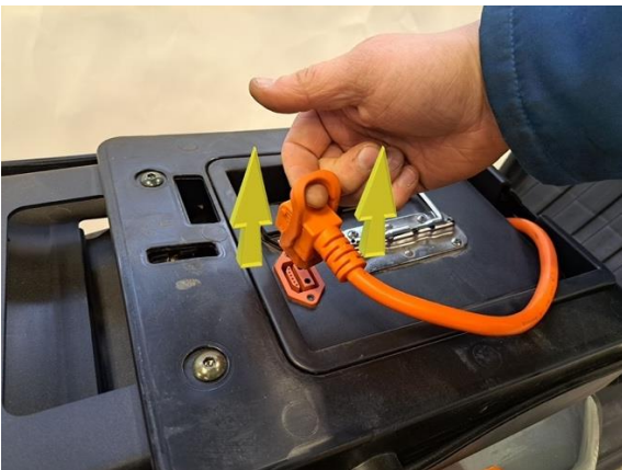
Irrota akun pistoke akusta.