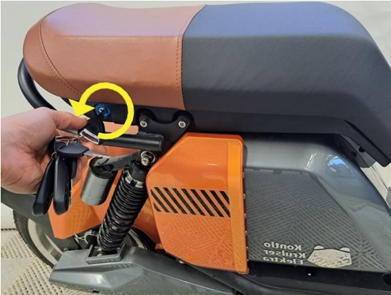
Avaa penkin lukitus avaimella.

Oire: Alentunut toiminta matka. Laite ei toimi ollenkaan.